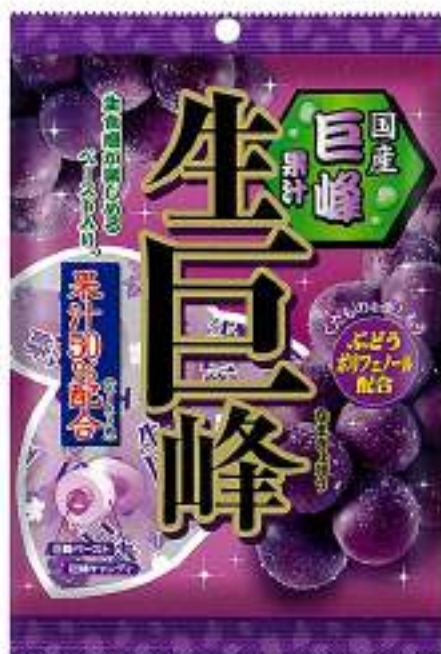
※デザインは変更する場合がございます。